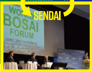
2016年防災ダボス会議にて 世界防災フォーラム開催を発表