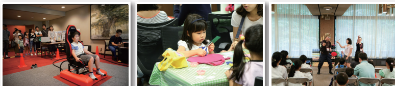
第1回防災推進国民大会より