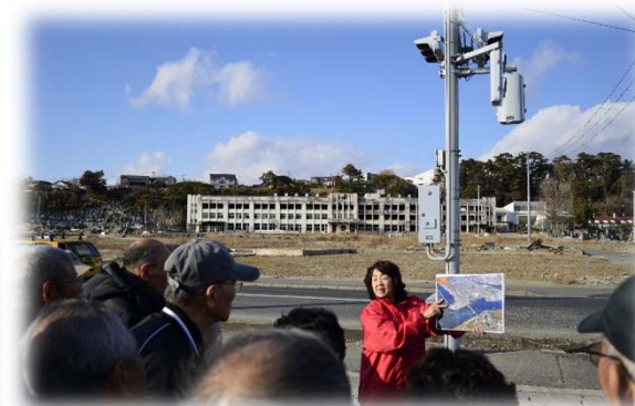
観光協会による語り部案内