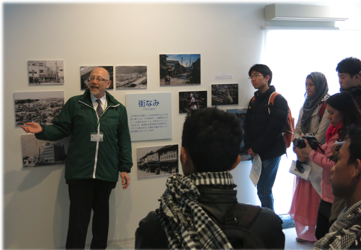
石巻市復興まちづくり情報交流館中央館