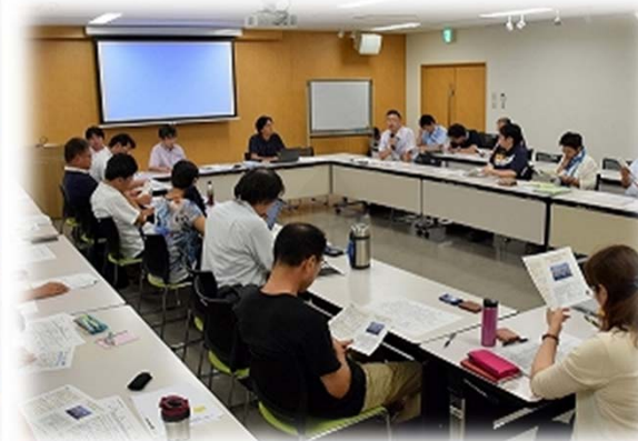
石巻ビジターズ産業ネットワークによるコンファレンス