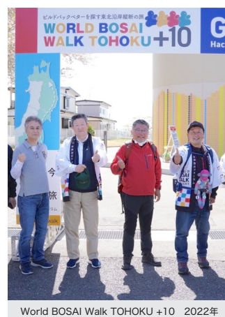
World Bosai Walk TOHOKU+10 2022年

私たちは、世界防災フォーラムにおいても企業サポーターとして「World Bosai Walk TOHOKU+10」への参加等、今後も仙台防災枠組の推進に貢献していきます。